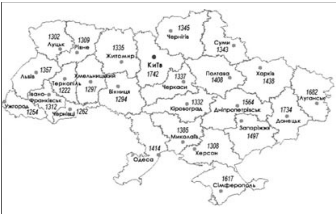
Рис. 2. Середні пенсії по регіонах України в грн.