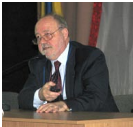
Фото 4. Доповідає професор Gianfranco Raimondi (Рим, Італія)